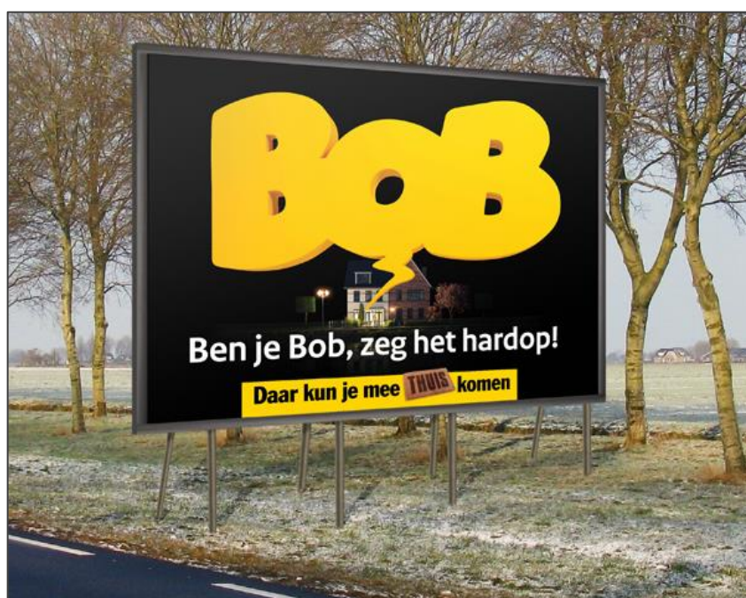
De BOB-campagne gebruikt commitment. Door hardop te zeggen dat je de BOB bent, houd je je eerder aan deze afspraak.

Een afspraak vastleggen zorgt ervoor dat de kans groter wordt dat mensen zich eraan houden. Zorg dus voor commitment om thuis te werken door bijvoorbeeld thuiswerkovereenkomsten, schema's om in te schrijven voor werken op kantoor en vaste online afspraken. In hoofdstuk 3 vind je voorbeelden die je zelf kunt invullen en gebruiken.